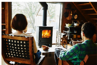
大人たちは薪ストーブを 囲んでお話ししましょう