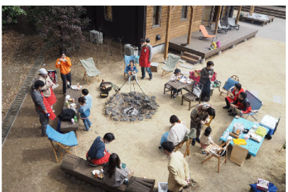
お天気が良ければ外で 焼き芋大会!