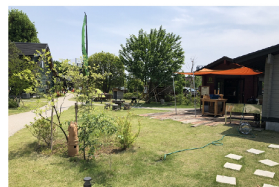
広い庭でお子さんたちは 思う存分遊ぶことができます